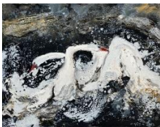
Kerstin Serz, „Streitschwäne II“, 2008 und 2021, Öl / Acryl