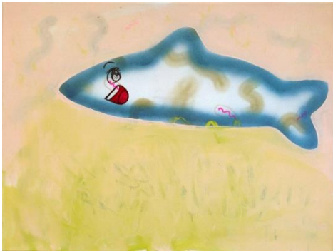
Marta Vovk, „Reminiszenz an Aal“, 2017, 60x80cm, Acrylic and flick pen on cotton, 1680 EUR