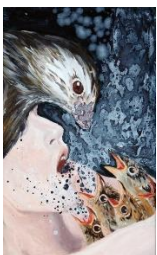
Kerstin Serz, „Heilgesang“, 60 x 30 cm, Öl / Acryl /Nessel 2020 60 x 35 cm, 2500 Euro