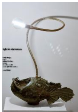
Sonja Baeger, „Light in the darkness“, 2020, Bronze 54 x 26 x 22 cm, Edition 10+2a.p. bronze 54 x 26 x 22cm brass light tube 120cm / 8500 EUR