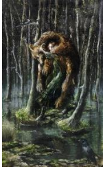
Andrea Lehmann, „Schwerer Bär III“, 2021, Öl auf Pappe, 38 x 26 cm, 2100 Euro