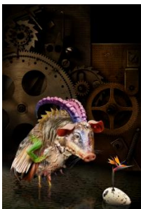
Oliver Schnell, Eierlegende Wollmilchsau, 2010

ELWMS, 30x24 cm, digitale collage, UV Tinten Druck auf Leinwand, Auflage 10+2, Schattenfuge Eiche, 2010, 550€