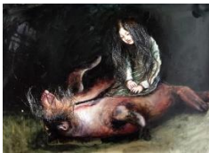
Andrea Lehmann, „Begegnung mit Sirene“, 2015, Öl, Papier, Haare, 60 x 83 cm, 4700 Euro