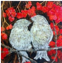
Kerstin Serz, „Sibirisches Fellfinkenpaar“, 2018, Öl und Acryl auf Nessel, 80 x 80 cm, 4300 €