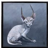
Kerstin Dzewior, "Hörnercat", 2010, 43 x 43 cm, Acryl auf Leinwand, 1850 EUR