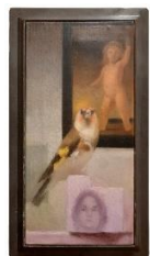
Stefan Höller, „Der Liebesbote“, 2021, Öl auf Leinwand, 23 x 11,5 cm, 5800 Euro