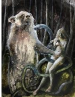
Andrea Lehmann, „Entstehender Bär“, 2021, Öl auf Pappe, 30 x 22 cm, 1700 Euro