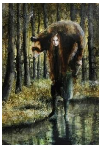
Andrea Lehmann, „Schwerer Bär II“. 2021, Öl auf Papier, 72 x 44 cm, 3850 Euro