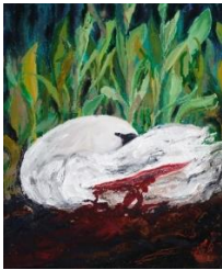
Kerstin Serz, „Die Schnittwunde“, 2014, Acryl / Öl / Nessel, 60 x 50 cm, 2900 Euro