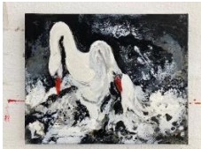
Kerstin Serz, „Streitschwäne“ I, 2008 und 2021, Öl / Acryl /Nessel 40 x 50 cm, 2400 Euro