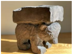
Stefan Rinck, „Lastenbär“, 2021, 1 von 10 / Bronze / Edition 10 + 3 AP / Originalgröße der Originalskulptur von 2007 aus Sandstein: 26x16x25,5cm, 5000 EUR zzgl. MwSt.